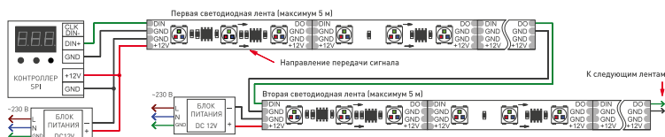
Рис. 2. Схема подключения ленты при управлении от внешнего контроллера